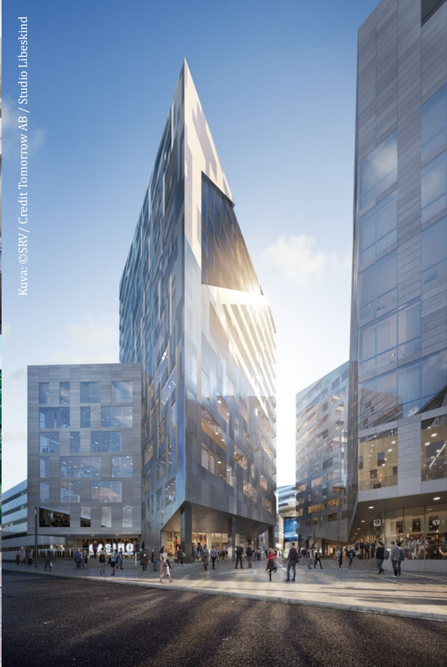
Kuva: ©SRV/ Credit Tomorrow AB / Studio Libeskind